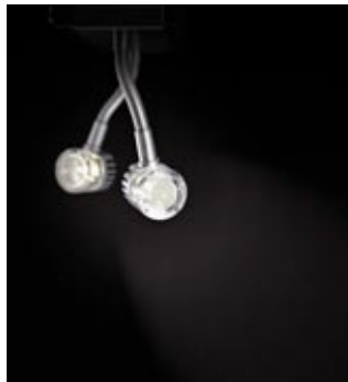
Geo2.jpg LED-Leuchte Geo gewinnt red dot design award