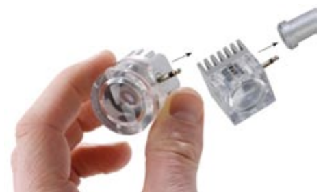
Geo3.jpg Geo. das Power-LED-Baukastensystem